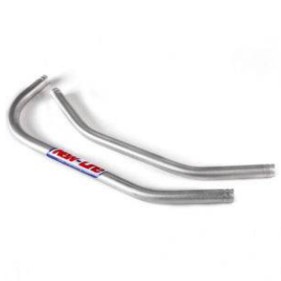
Tubi in alluminio