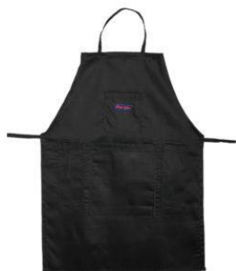
Grembiule da lavoro

Pubblico: € 24.40 COD N-L149 peso: 450 g