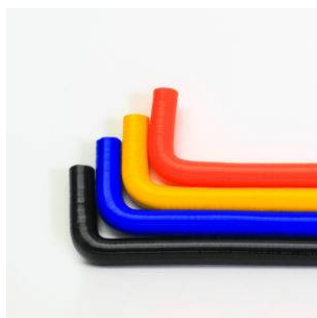
Tubi in silicone