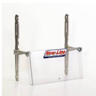
Parzializzatore RS / RS-S1 / New