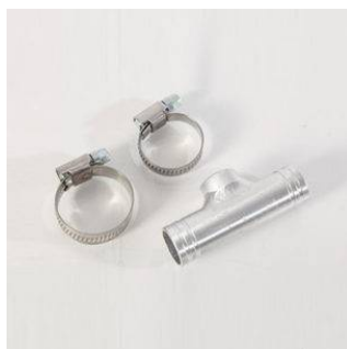
Raccordo sonda acqua