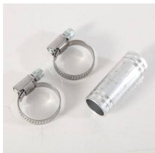
Raccordo tubo in silicone