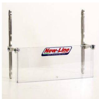
Parzializzatore Big / Big-S1 / Double