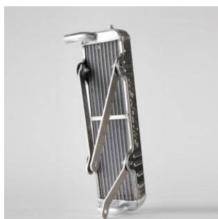
Radiatore Hobby Plus

Pubblico: € 140 COD N-L102 misure: 12 x 43 x 4 peso: 1,400 kg