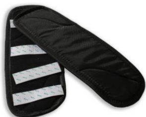
Imbottitura schiena sedile